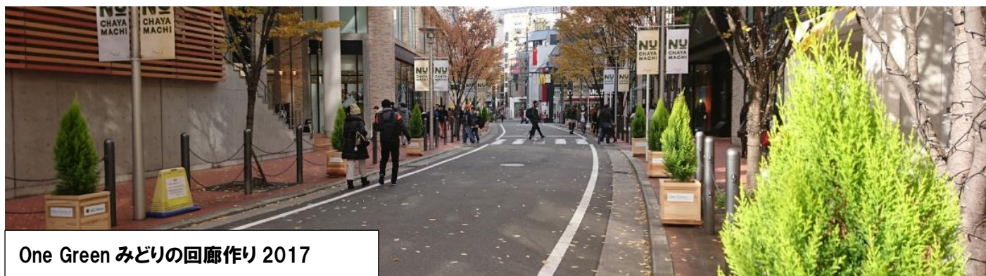
One Green みどりの回廊作り 2017