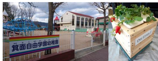
植育 Box を用いたイチゴ狩り体験を予定しています。 (準備中)イメージ

協賛: MBS(株式会社毎日放送)、阪急電鉄株式会社、 株式会社竹中工務店、大和リース株式会社、 東邦レオ株式会社、一般財団法人レオ財団