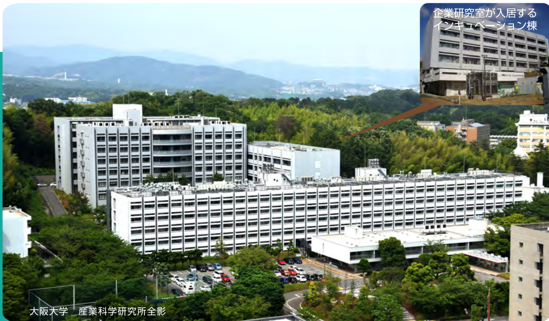
大阪大学 産業科学研究所全影